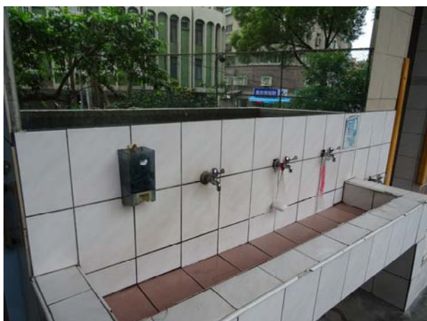
全校共 96 座洗手台