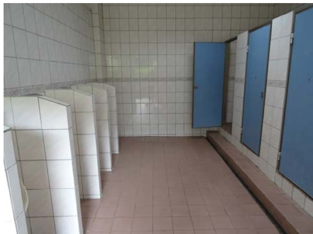
全校蹲式馬桶 238 座、小便斗 130 座