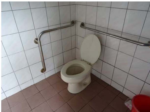
坐式馬桶 14 座（無障礙廁所）