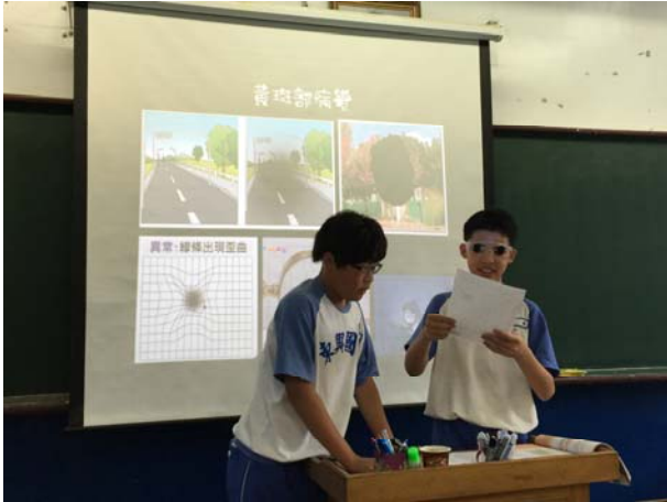
健康教育課-「天瞎一翻」 分組報告