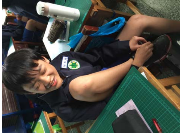
健康教育課-「天瞎一翻」 盲人體驗