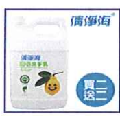
清淨海 環保洗手乳... $1798